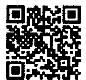
สแกน QR Code

③ ฝ่ายรับนักศึกษา 0 2504 - 7213 ④ ศูนย์บริการร่วมครบวงจร ONE STOP SERVICE อาคารบริการ 1 ชั้น 1 มสธ.